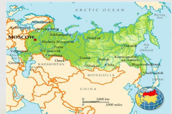
РИСУНОК СХЕМА ТЕКСТ ФОТОГРАФИЯ КАРТА ЧЕРТЕЖ