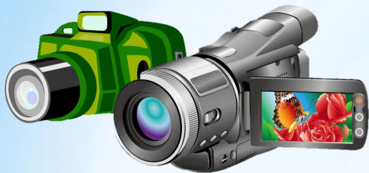
Фото и видеокамеры