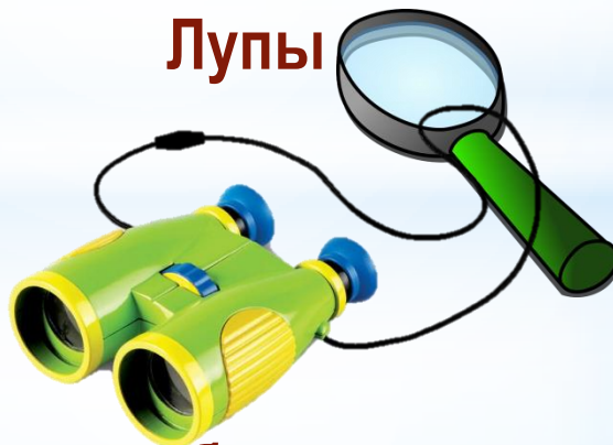
Лупы и бинокли