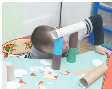
Ворота. Эта идея мне понравилась, но они не очень

Вывод: Мне понравилась идея передвижного мостика. У меня много машинок и мне он очень нужен для игр.