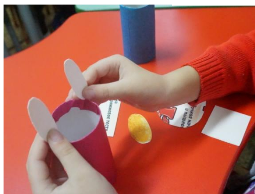
Зайчик. Вариант хороший, но подобная игрушка у меня есть.