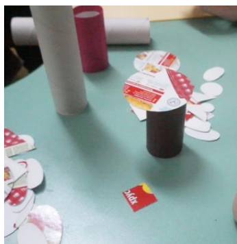
Грибок. Идея мне не понравилась, очень