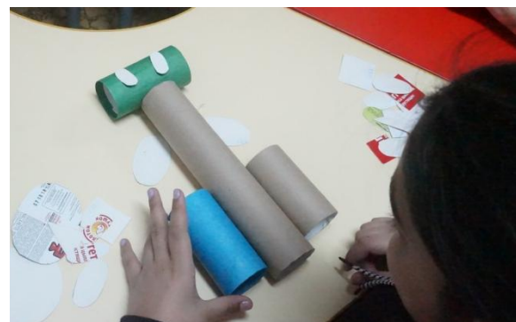
Инопланетянин. Идея интересная, но мне не понравились руки, очень короткие.