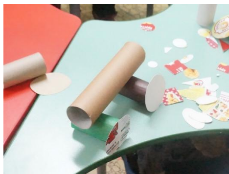
Передвижной мостик. Идея понравилась, мостик необычный у меня такого нет.