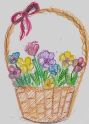
Цветы из фетра