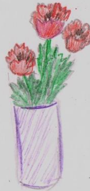
Маки из бисера