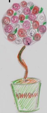
Цветы из фетра